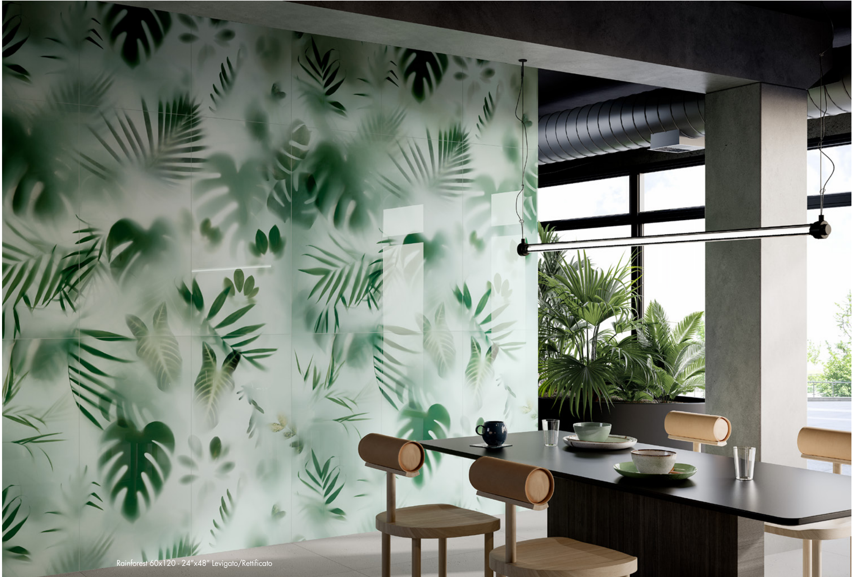
Rainforest 60x120 - 24"x48" Levigato/Rettificato